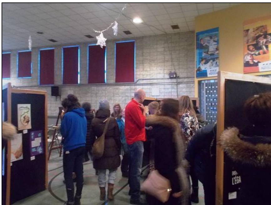
Gala de remise des prix à l'école Joseph-François-Perreault