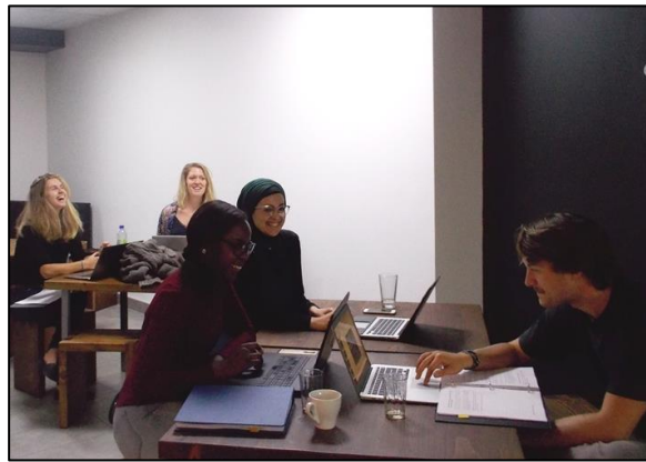
Séance de travail pour le nouveau et les nouvelles animatrices lors de la journée de formation de l'équipe d'animation.

Le 10 octobre 2017, une formation d'une journée a été prodiguée à l'équipe d'animation afin d'assurer la maîtrise du contenu et des outils pédagogiques. Cette journée est l'occasion d'expliquer le contenu des ateliers et de favoriser sa compréhension.